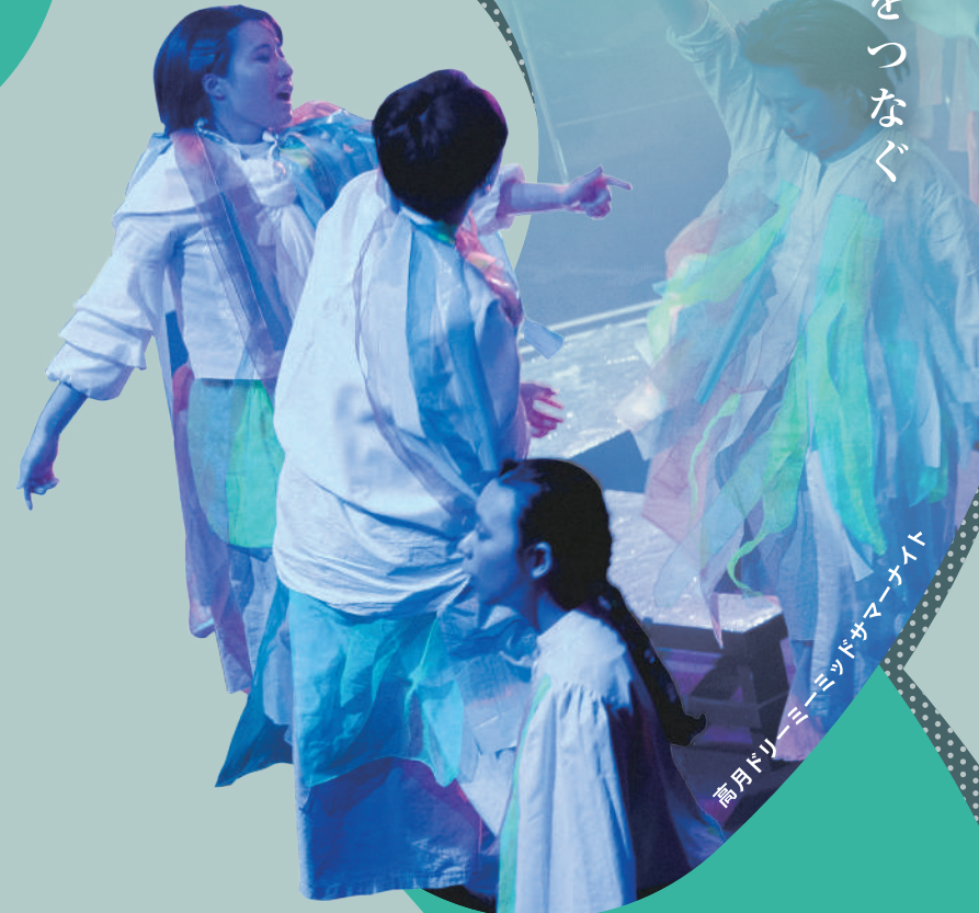
高月トリニエートナイト