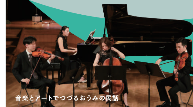
音楽とアートでつづるおうちの民話